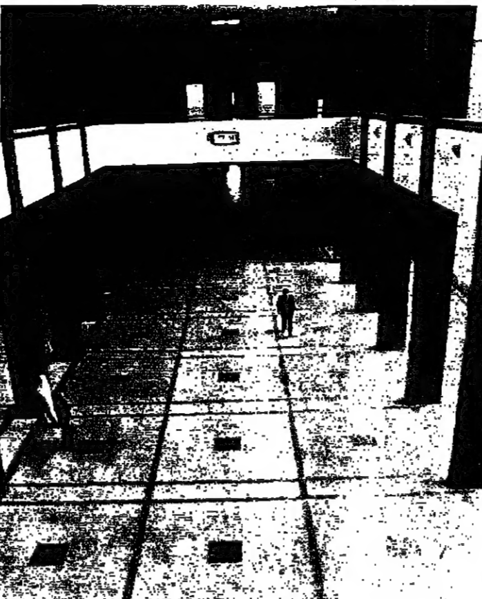
قاعة قمر العدل من الداخل